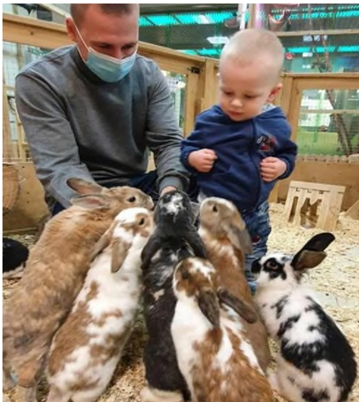
1-rasm. Yoshlar bilan tomorqadagi mehnat jarayoni

Shaxsning ekologik madaniyati – bu tabiatni muhofaza qilish, uning boyliklaridan oqilona foydalanish, ekologik hissiyot, ehtirolarning shakllanishi, faol hayotiy nuqtai nazarda turish, ekologik bilimga ega boʻlishdan iboratdir. Shuningdek, Ekologik madaniyat deganda tabiat haqidagi bilim, ong, idrok, savodxonlik, intellektual salohiyat va uni amalda qoʻllay bilish faoliyati, atrof-muhitga nisbatan faoliyatning yuksak koʻrsatkichi, ongli va maʼsuliyatli yondashuvlaridir [3, 4].