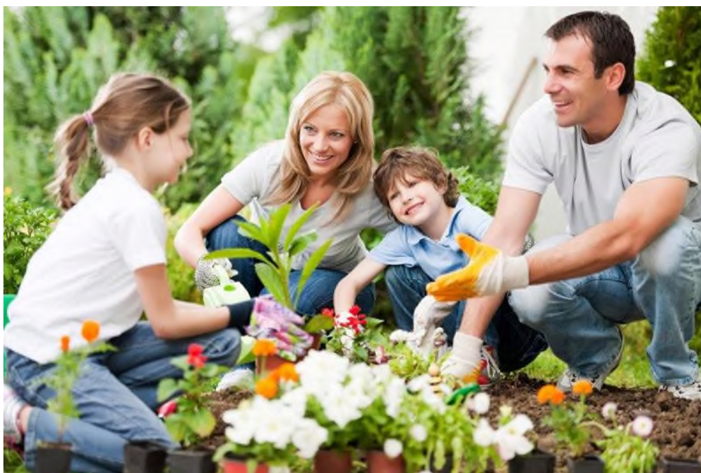
2-rasm. Yoshlar bilan tomorqadagi mehnat jarayoni

Har bir oilada yoshi kattalar tabiat, o‘simlik va hayvonot dunyosi, o‘lkashunoslik, ekoturizm kabi mavzularidagi multfilm va ko‘rsatuvlarni o‘z farzandlari bilan birga ko‘rib, uni muhokama qilishlari, uning tarbiyaviy jixatlarini yoshlarga tushuntirib berishlari, multfilmdan ko‘zlangan tarbiyaviy xulosalarni yoshlarga anglatmoqliklari juda muhim ekologik tarbiya hisoblanadi. So‘ng olingan bilimlarni tabiat qo‘ynida amaliy ishlarni bajarish orqali mustahkamlab borishlari talab etiladi. Jumladan, yoshlar bilan birga turli daraxt va gul ko‘chatlari ekib, bog‘lar tashkil etish, uy hayvonlarini parvarishlash, tomorqada turli – xil ekinlarni yetishtirish maqsadga muvofiqdir (1, 2-rasm).